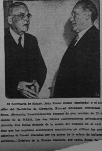
El Secretario de Estado, John Foster Dulles (izquierda) y el Canciller del Occidente de Alemania, Konrad Adenauer, conversan en Bonn, Alemania, inmediatamente después de una reunión de 15 naciones de la NATO. Los dos líderes conferenciaron pretidamente durante tres horas después de la sesión del Consejo en el cual se dice que las naciones occidentales conviniere en utilizar las armas atómicas si fueran atacadas por los países de la esfera de influencia soviética. —Pasa a la PAGINA TRES