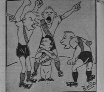
La Liga: Griten cuanto quieran, pero el "38" se aplica.