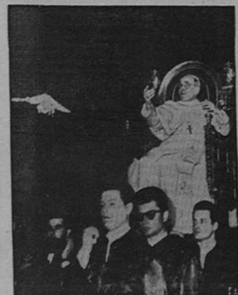
Sorprendido en forma evidentemente grata Su Santidad el Papa Pio XII sentado en trono pontifical y entrando a la Basílica de San Pedro, se inclina hacia una palomita blanca que se le había escapado a uno de los 20.000 obreros manifestantes a quienes concedió audiencia el Pontífice.—Fotografía de la V. A. por radio, desde Roma.